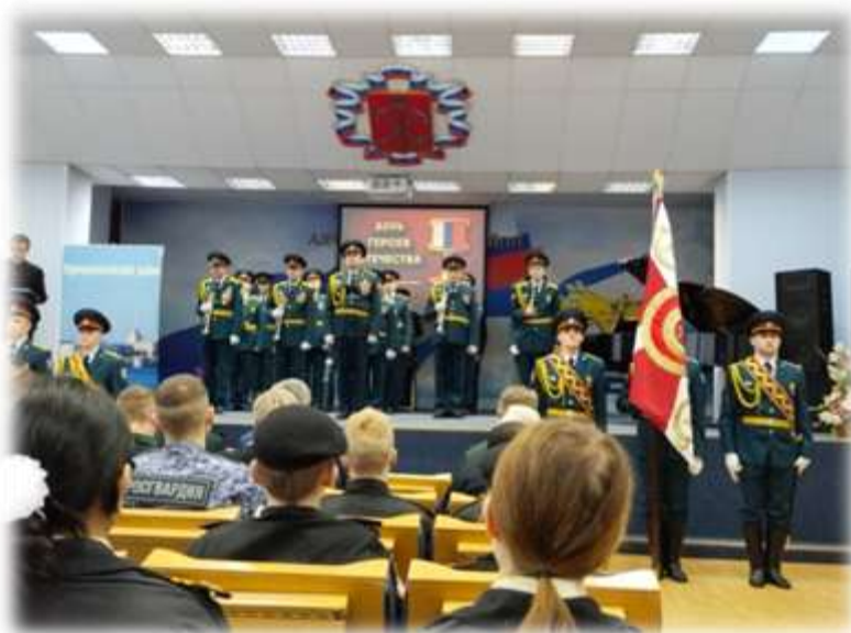
13 января 2023 года. Школа. Акция «Блиндажная свеча»

08 декабря 2022 года. Администрация Адмиралтейского района СПб. Торжественное мероприятие, посвященное Дню Героев при участии Росгвардии.